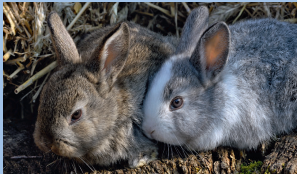
Heute heiß geliebt – morgen abgeschoben. Auch Kaninchen erleiden dieses Schicksal

Gleich am frühen Morgen des 12. Dezember, einem Tag wie jeder andere, werden zwei Kaninchen im Tierheim abgegeben. Eigentlich ist das Heim noch geschlossen, doch die Klingel wird so lange betätigt, bis ein Tierpfleger sie hört und seine Arbeit bei der Tierpflege unterbricht. Die Überbringer am Tor erklären, dass sie die Tiere aus einem Haushalt „rausgeholt“ hätten, in dem die Kaninchen vernachlässigt worden seien. Allerdings habe man feststellen müssen, dass die Pflege doch umfangreicher sei und man diese nicht gewährleisten könne. Konsequenz: Die Tiere müssen ins Tierheim.