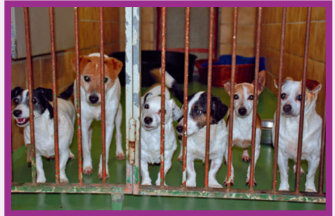
Lene, Bernie und Schneewittchen fanden direkt Anschluß im Tierheim

Doch betagte Tiere müssen nicht nur zu älteren Menschen, das ist sicher. Sehr genau werden im Tierheim die Lebensumstände der möglichen neuen Besitzer erfragt. Besonders alte Hunde und Katzen können viel tun, damit es ihrem Menschen gut geht. Sie können Trost spenden, zuhören oder Kontaktvermittler zu anderen Tierbesitzern sein. Haustiere, das ist wissenschaftlich erwiesen, fördern die Gesundheit auf vielfältige Weise.