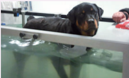
Thyson in der Physiotherapie

In unserer letzten Ausgabe stellten wir Ihnen den Sorgenfall „Thyson“ im Tierheim Oekoven vor. Viele Menschen halfen ihm mit einer Spende, und die erste der drei notwendigen