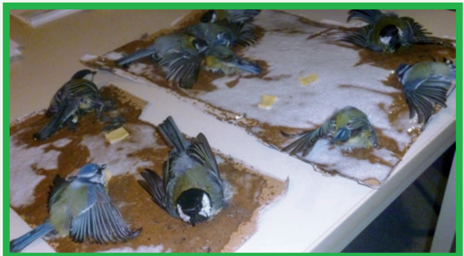
Qualvoller Tod von geisteskranken Tierquälern verursacht

Zunächst unglaublich, aber dennoch leider wahr, ist ein Vorfall in Dormagen-Hackenbroich. Dort wurden in Gebüsch Vogelfallen der besonders grausamen Art gefunden. Mit Klebstoff bestrichene Pappen waren geschützt in den Sträuchern ausgelegt und mit Käseködern bestückt.