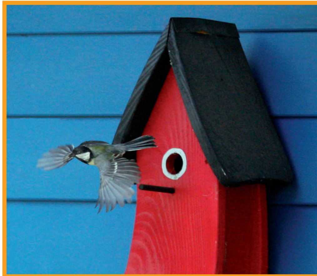
Ein dekorativer Nistkasten wird durch seine Bewohner richtig schön

Generell bestimmt die Größe des Einschluflochs, welche Vogelart sich im Nistkasten ansiedelt. Einige Arten stellen zusätzliche Anforderungen an ihre Brutstätte. So braucht z.B. der Baumläufer einen direkt am Baum angebrachten Nistkasten mit zwei seitlichen Ein-