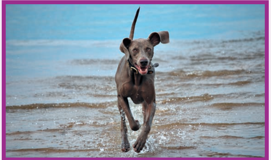
Auch Dino ist ein Weimaraner mit viel Temperament

Denn leider orientieren sich viele Hundefreunde bei der Wahl ihres Vierbeiners ausschließlich an äußerlicher Schönheit und modischen Aspekten. Zu wenig wird darauf geachtet, ob die Bedürfnisse der jeweiligen Rasse in die menschlichen Lebensumstände passen. „Dino“ passte nicht. Der Weimaraner wuchs in einer Familie mit Kleinkind auf. Angeschafft wurde er wegen seiner schönen Farbe, über seine rassetypischen Eigenschaften informierte man sich nicht. Weimaraner sind Jagdgebrauchshunde mit hohem Bewegungsdrang. Damit sie zu einem entspannten Familienmitglied werden, müssen die selbstbewussten Tiere täglich körperlich und geistig gefordert werden, - sie brauchen also eine sachkundige Führung. Sind diese Voraussetzungen nicht gegeben und ist der Hund unterfordert, kann sein Verhalten schnell in Aggressivität umschlagen.