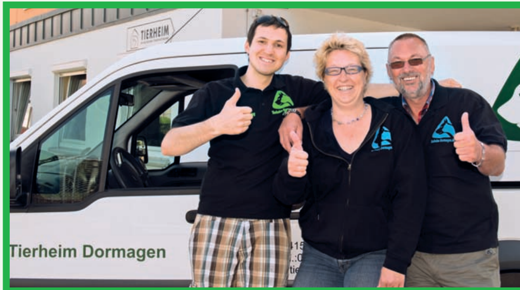
Der neue Vorstand des Tierschutzvereins Dormagen

Auch die an die Katzenräume anschließenden Ausläufe erhielten im Zuge der begonnenen Sanierungsmaßnahmen neue Fliesen. Noch ausstehend ist die Wiederherstellung des Wasserablaufs im Freilaufgehege – hier sammelt sich, da nach Regenfällen der Wasserablauf nicht einwandfrei funktioniert, das Wasser häufig in mehreren Bereichen einige Zentimeter hoch an. Und auch in der Kleintierabteilung wird es Veränderungen geben, so sollen die alten Stallungen durch neue ersetzt werden,