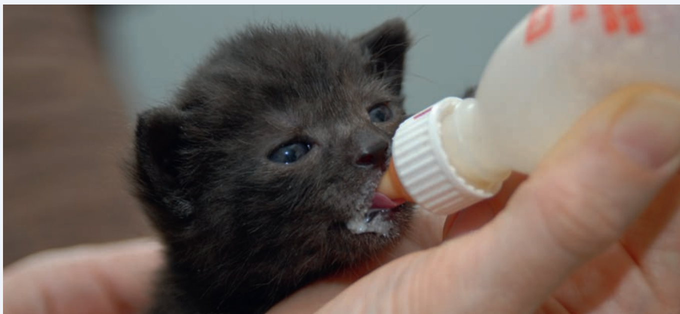
Alle zwei bis drei Stunden werden Katzenkinder mit Aufzuchtsmilch versorgt – auch über Nacht

Gassi-gehen: So - Fr 9.30 / 10.30 / 11.30 Sa 14.00 - 15.00 Uhr