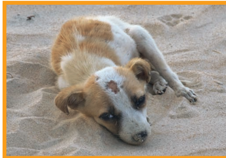
Streuner am Strand – ohne große Hoffnung

„unter tierischer Beteiligung“ werden von vielen Tierfreunden nicht als verdächtig erachtet. Dass sich der Besuch einer Stierkampfarena grundsätzlich verbietet, ist hinlänglich bekannt. Aber einen Tag, an dem die Sonnengarantie einmal nicht greift, könnte man doch in dem vom Hotel beworbenen Safaripark oder einem Delphinarium verbringen. So meinen jedenfalls viele. Nachher sind die Menschen schlauer, und die